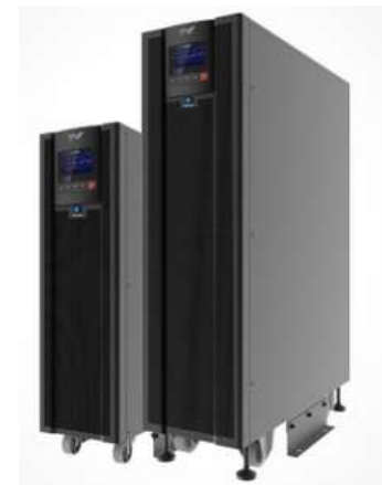
SÉRIE CKU33-CMYS (10-40kVA)